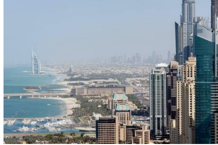
Die PTV Group sieht ein großes Potenzial für Mobilitätslösungen im Mittleren Osten, in Afrika und Indien.